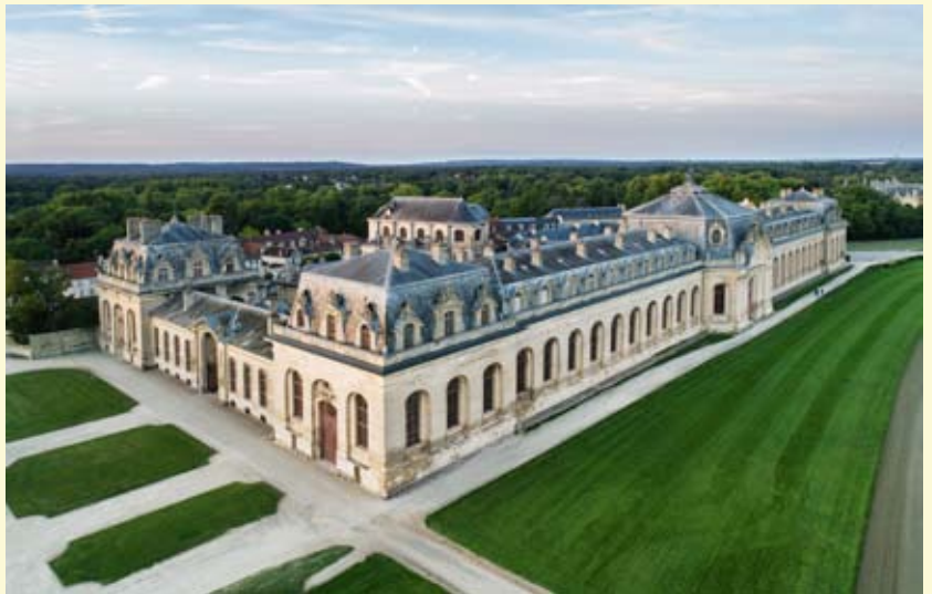
Grandes Ecuries de Chantilly

Construit par l'architecte Jean Aubert pour Louis-Henri de Bourbon, 7ème prince de Condé, qui croyait en la métempsychose et pensait ainsi se réincarner en cheval, ce véritable palais pour chevaux a fêté récemment son tricentenaire et est considéré comme les plus belles écuries au monde.