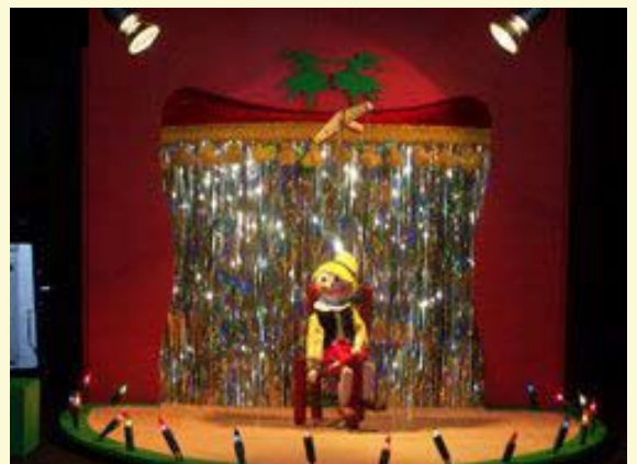
Mini mini comico circus