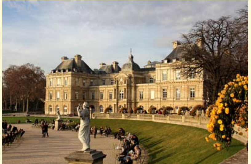
Le Sénat est accueilli dans le Palais du Luxembourg, rue Vaugirard, dans le 6e arrondissement de Paris

La Mairie invite les enfants de Saint Roman à un goûter de Noël et à un spectacle de marionnettes « le Mini mini Comico Circus ». Nous vous préciserons l'heure du spectacle prochainement.